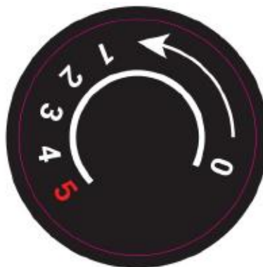
Bouton du thermostat

Notes : La plage de température est donnée à titre indicatif. Elle pourra varier en fonction des conditions d'utilisation.