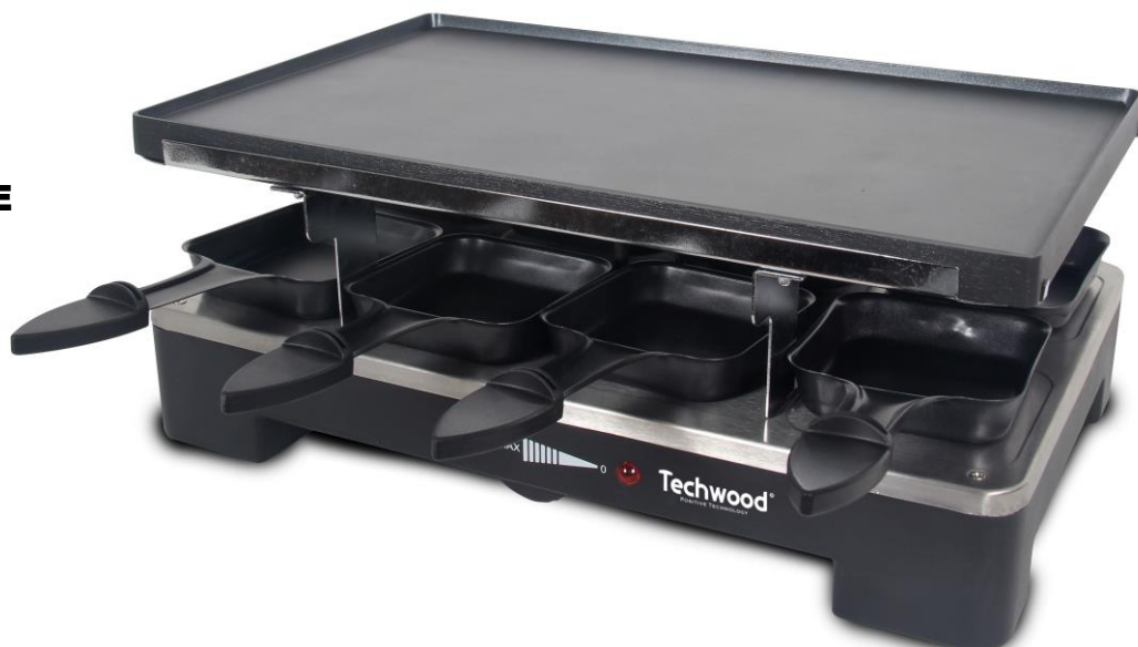
FACE PLAQUE DE CUISSON